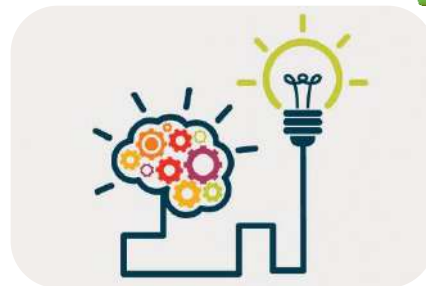
بهینه سازی روش های اجرایی

بازنگری در گروه بندی رشته ها، ضرایب و سرفصل های دروس آزمون های کارشناسی ارشد، دکتری و استخدامی، ارائه الگوی بهینه آزمون های صلاحیت حرفه ای برای سازمان سنجش، طراحی نظام صلاحیت حرفه ای طراحان آزمون های ورودی آموزش عالی و استخدامی، بررسی نتایج و پیامدهای پذیرش بدون آزمون و بر مبنای سوابق تحصیلی، بررسی روشهای بهینه سازی فرایند انتخاب رشته آزمون های سراسری، طراحی الگویی نو برای سنجش و پذیرش در بخش عملی آزمون های سراسری، آسیب شناسی فرایندهای اجرایی آزمون های سراسری و ارائه برنامه اقدام، طراحی سازمان اجرایی آزمون های الکترونیکی