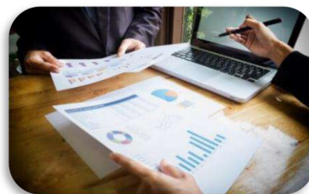
ارزشیابی و اعتبارسنجی

بررسی الگوهای بهینه اعتبار سنجی حوزه های برگزاری آزمون و ارائه الگوی مناسب، بررسی تأثیر روش های سنجش و پذیرش بر کیفیت ورودی های آموزش عالی، ارائه سازوکار مناسب مدیریت و ارزیابی عملکرد طراحان سؤال، طراحی جایزه ملی کیفیت در نظام آموزش عمومی (پیش از دانشگاه)، طراحی جایزه ملی کیفیت در نظام آموزش عالی، آسیب شناسی سازوکارهای ارزیابی و نظارت در نظام آموزشی و ارائه برنامه اقدام، طراحی نظام آموزشی و صلاحیت حرفه ای ارزشیابان در نظام آموزشی، بررسی سازوکارهای اعتبارسنجی در سطوح مختلف نظام آموزشی و ارائه برنامه اقدام، آینده پژوهشی سنجش، ارزشیابی، اعتبارسنجی و تضمین کیفیت در نظام آموزشی