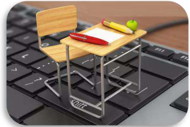
آزمون های الکترونیک و هوشمند